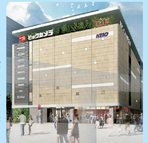
ビックカメラ京王調布店 外観

また、急ぎの買い物をサポートする、インターネット取り置きサービス専用の商品受け渡しカウンターを1階に設けました。東京のベッドタウンという同店の立地から導入したこのサービスは、商品のピックアップを当社従業員が行うことから通勤帰りの買い物がスムーズで、早くも人気となっています。今後も、ネットとリアルが連携したサービスに力を入れていきます。