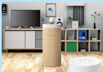
スマートホームコーナー

当社では都市立地の強みを活かし、AIスピーカーやIoT家電といった、時代の最先端を行く商品をいち早く体験、体感できる取り組みに力を入れています。本年10月、話題のAIスピーカー「Google Home(グーグルホーム)」が発売されましたが、当社では他社に先駆けて、「Google Home」を体感できる「スマートホームコーナー」を、ビックカメラ有楽町店など10店舗に開設しました。