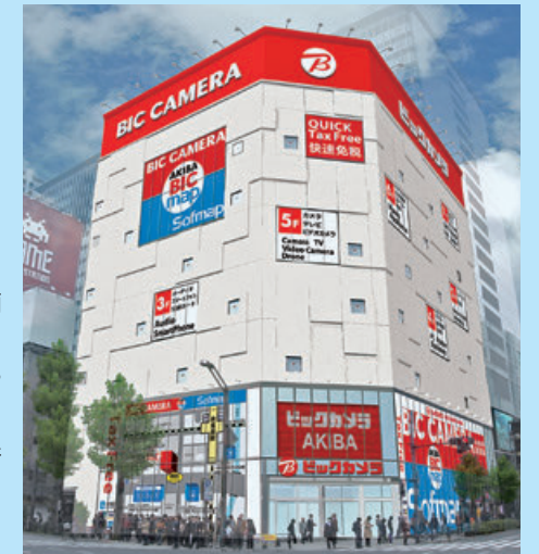
ビックカメラAKIBA 外観

当社グループでは、秋葉原電気街のビックカメラとソフマップの計6店舗を「AKIBAビックマップ」と総称し、ビックカメラグループならではの品揃えやサービスを提供することにより、家電とサブカルチャーの聖地、そして観光の街としても発展を続けている秋葉原のマーケットにお応えしていきます。