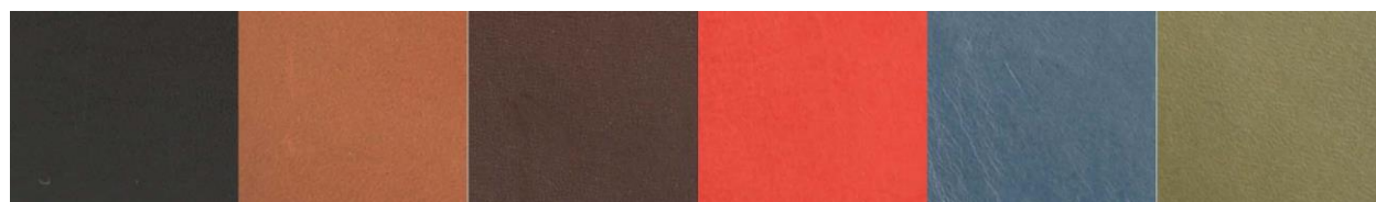
ブラック コニャック ダークブラウン レッド ブルー グリーン

③ご希望によりステッチを入れることができます。ステッチの色は、革色ごとに 3 色から選べます。