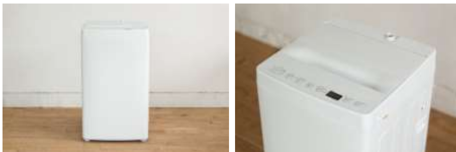
洗濯機は生活空間に馴染むように、シンプルなホワイト 1 色展開。操作パネルは英文表記でスタイリッシュに。

「TAG label」初の新品となる全自動洗濯機を、平成 29 年 12 月 18 日（月）、続いて 32V 型液晶テレビを、同 12 月 28 日（木）に発売いたします。以降、スーツケースや寝具、キッチンタイマー、キッチンプレートなど、商品を順次発売し、現在の約 5 倍の 100 種類の商品展開を目指してまいります。