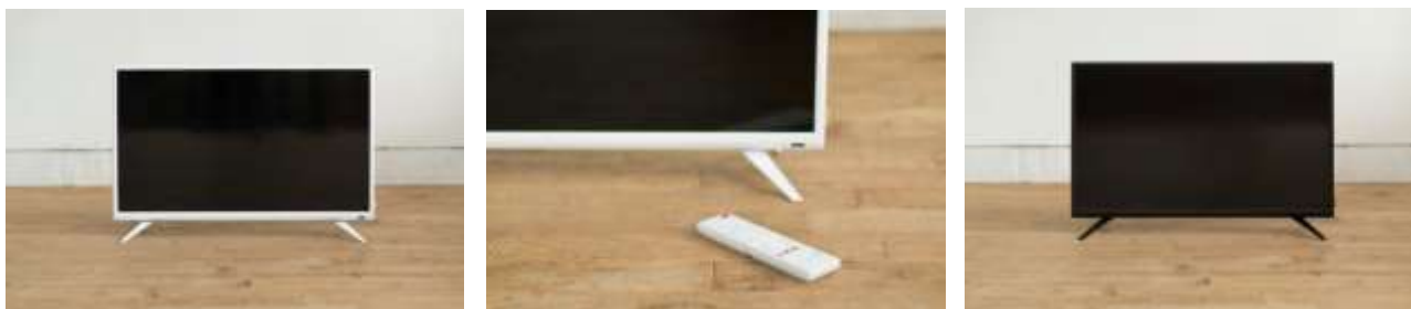
液晶テレビはホワイトとブラックの 2 色展開。現代生活に必須の USBHDD 接続による裏番組録画等にも対応。