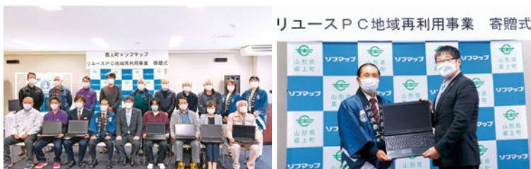
山形県最上郡最上町との取り組みでは、役場にて寄贈式を実施しました