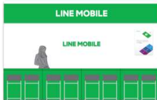
「LINE モバイル」即時発行カウンターイメージ

当社は、平成 25 年にオリジナル SIM カード「BIC SIM」の販売を開始した以降、格安 SIM の品揃えを拡大すると共に、格安 SIM のご相談・各種サービスを承る即時発行カウンターの設置を進めております。当社が今回行う店頭販売および即時発行サービスは、「LINE モバイル」では、初めての取り組みとなります。